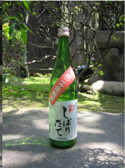
大高の山盛酒蔵 絵：浜島博夫