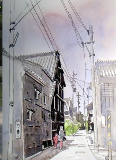
山盛酒蔵 絵：浜島博夫

歴史のまち大高で酒造りをする「鷹の夢」の蔵元「山盛酒造・明治20年・1887年」創業で酒蔵ライブ・「鷹の夢&谷辺昌央夢仕込みライブ」を開催します。