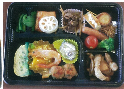
(おつまみイメージ)